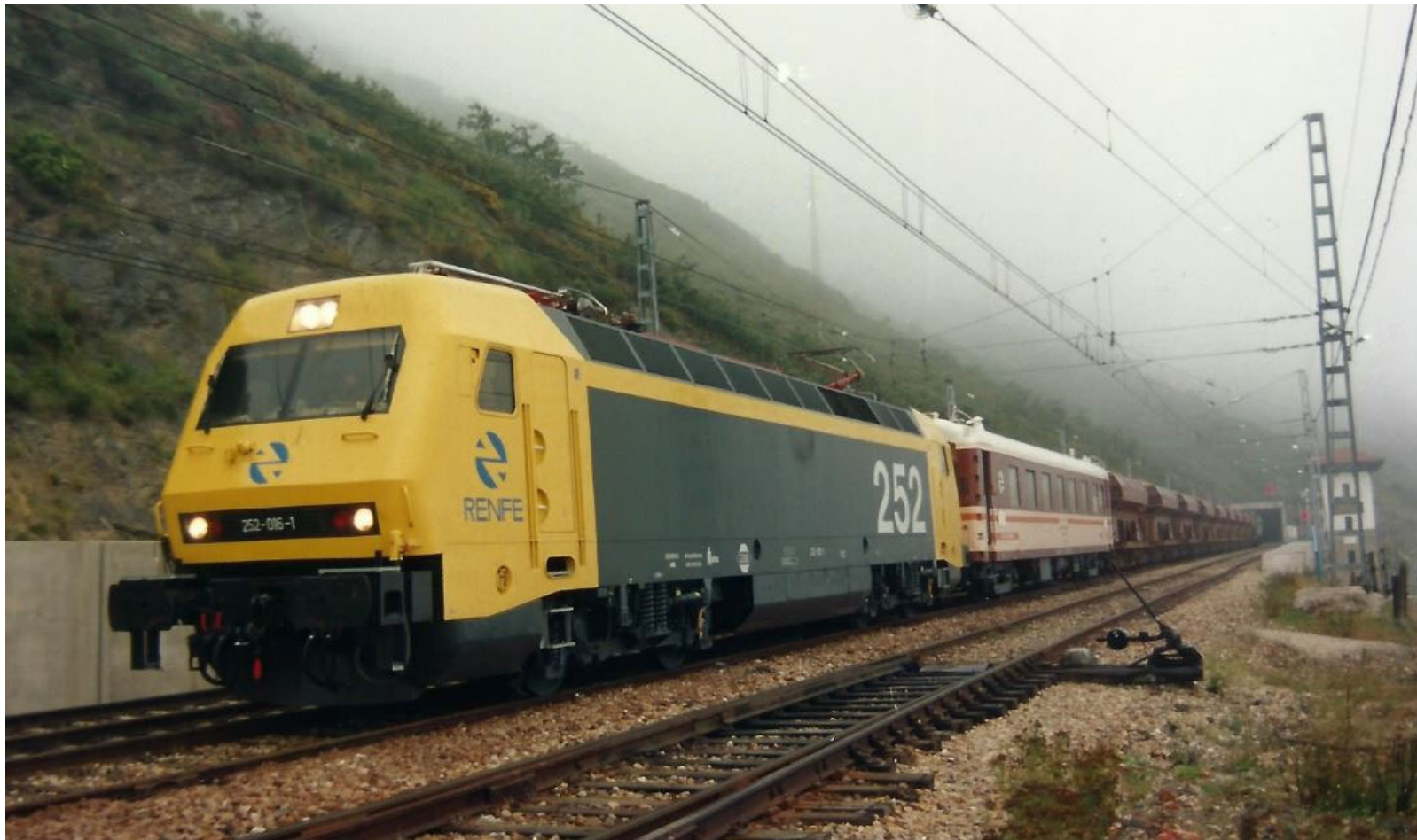
La locomotora 252-001 durante las pruebas de tracción en la rampa de Pajares junto con el coche dinamométrico. Chema Martínez.