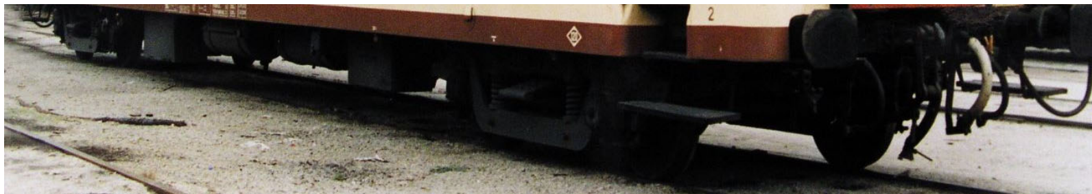
El coche LLI-5001 con el esquema de pintura reproducido para el Club Electrotren.

En el transcurso de estos recorridos experimentales, viajaban en el coche varios ingenieros y personal especializado adscrito a los servicios técnicos de RENFE, además de aquel otro vinculado al constructor del vehículo objeto de examen.