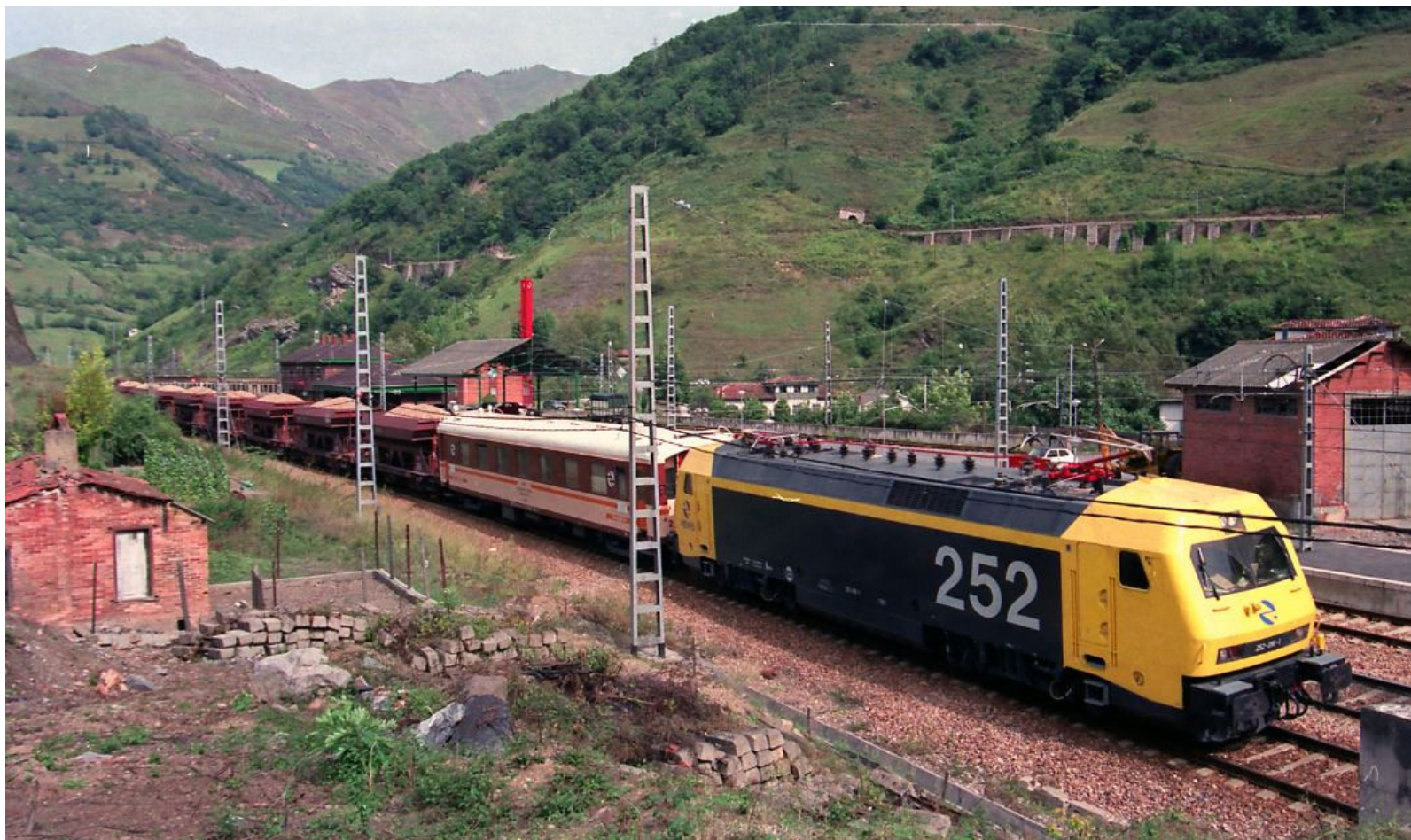
La locomotora 252-001 en Puente de los Fierros junto con el coche dinamométrico. Chema Martinez.

Debe reseñarse que, tanto los elementos estructurales de evaluación técnica como los diversos aparatos de medición, se encuentran actualmente en estado de funcionamiento. Tan sólo resulta necesaria, para su plena funcionalidad, la oportuna calibración de los equipos.