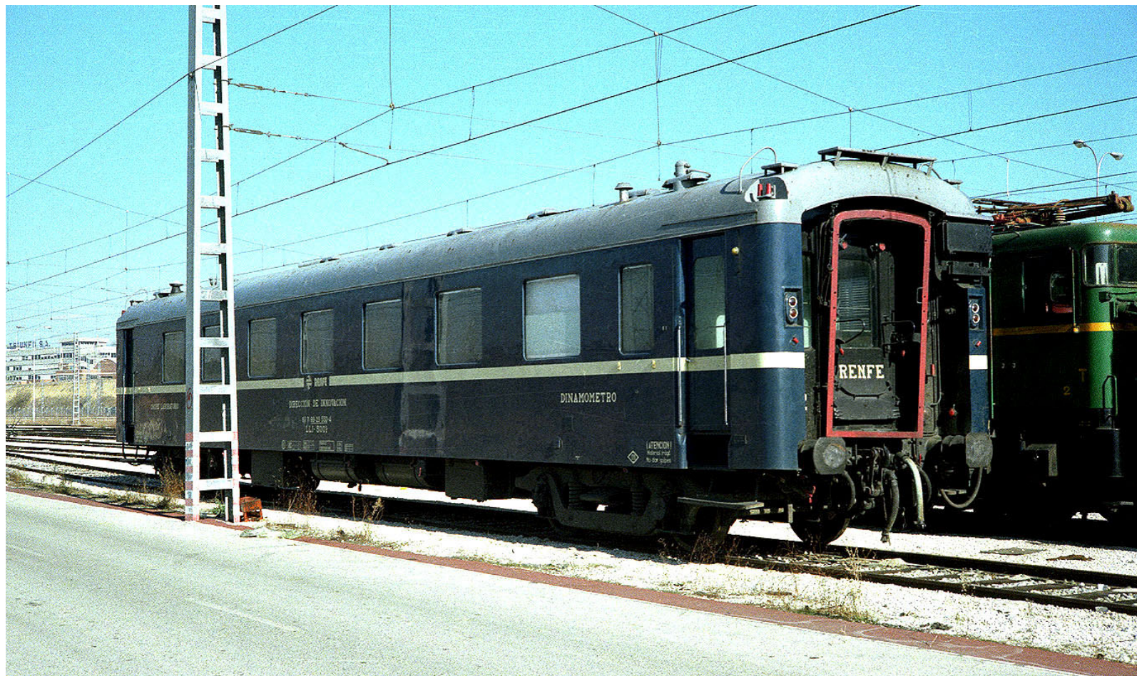
Coche dinamométrico en color azul con franja plata.

El coche dinamométrico LLI – 5.001 fue empleado tras la recepción de la totalidad de locomotoras de RENFE a lo largo de su dilatada trayectoria que se prolongó más de cuatro décadas. Su utilización resultó especialmente útil a la hora de determinar potencias y esfuerzos de tracción en locomotoras de vapor, ya que era el único medio experimental capaz de plasmar el comportamiento práctico de las mismas.