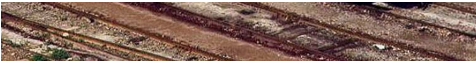
El coche LLI – 5.001 estacionado en Valencia-Término.

Las mediciones llevadas a cabo por este tipo de vehículos se reflejaban en largas tiras de papel que eran analizadas en busca de la respuesta de la locomotora según la carga y el perfil de la vía.